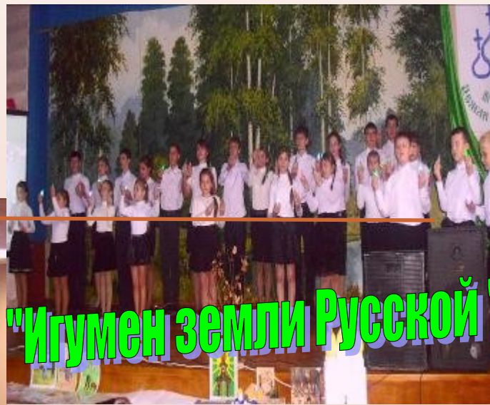
"Игумен земли Русской"