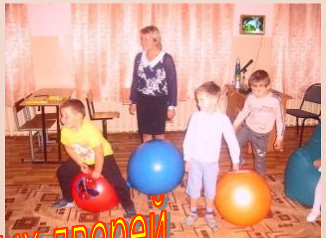
День открытых дверей