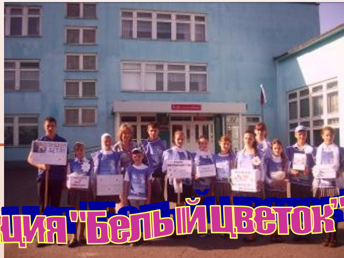
Акция "Белый цветок"